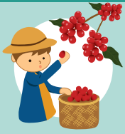
เก็บผลกาแฟ ที่ค้างบนต้นให้หมด

เกษตรกรควรใช้หลาย ๆ วิธีร่วมกัน และร่วมมือกันกำจัดมอดเจาะผลกาแฟ ในพื้นที่ใกล้เคียง เพื่อป้องกันแมลงเคลื่อนย้าย