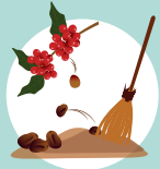
รักษาความสะอาดแปลง กำจัดผลกาแฟร่วง