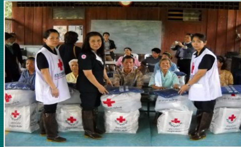
อ.น้ำปาด จ.อุตรดิตถ์