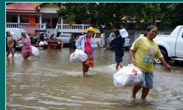
จ.สิงห์บุรี จ.นครสวรรค์ และจ.นครนายก