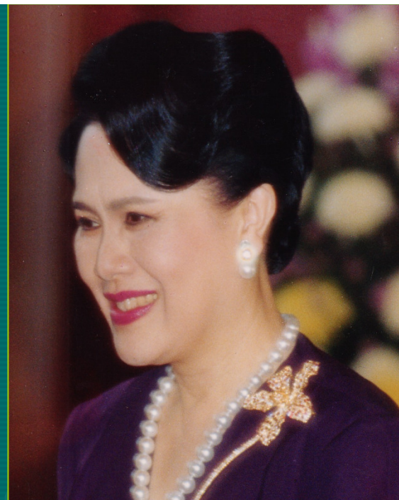
สมเด็จพระนางเจ้าสิริกิติ์ พระบรมราชินีนาถ สภานายิกาสภากาชาดไทย