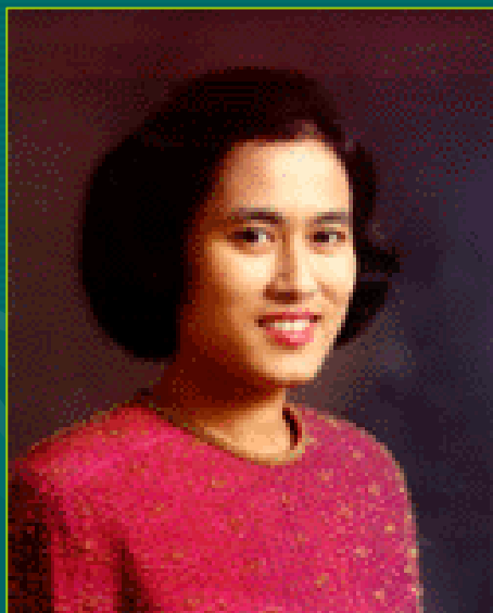
สมเด็จพระเทพรัตนราชสุดา เจ้าฟ้ามหาจักรีสิรินธร รัฐสีมาคุณากรปิยชาติ สยามบรมราชกุมารี อุปนายิกาผู้อำนวยการสภากาชาดไทย