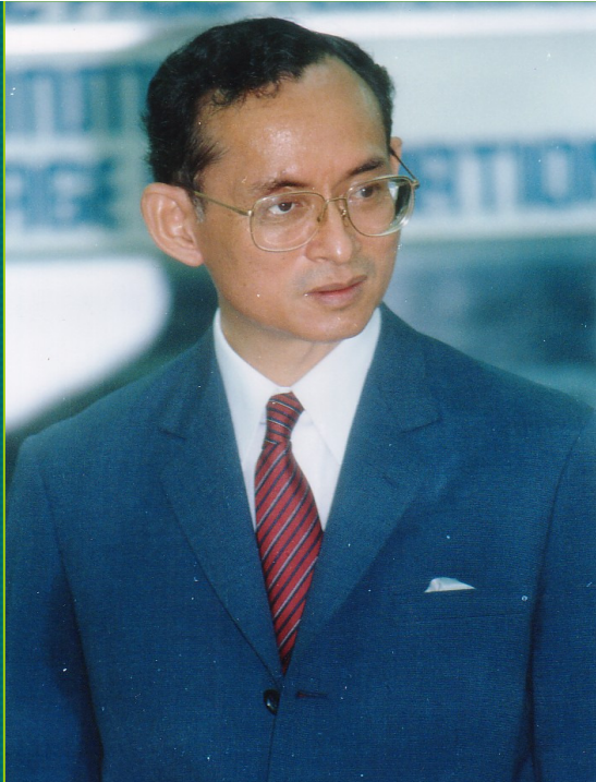
พระบาทสมเด็จพระปรมินทรมหาภูมิพลอดุลยเดชมหาราช พระบรมราชาูปถัมภกสภากาชาดไทย