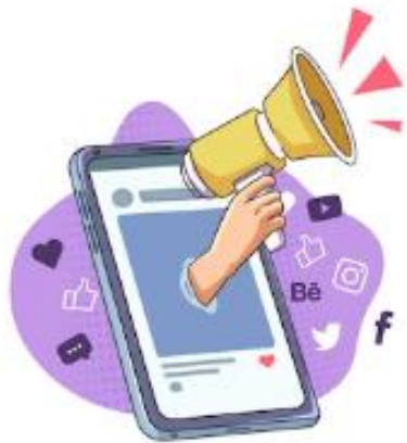
การพัฒนาช่องทางการจำหน่ายและการตลาด