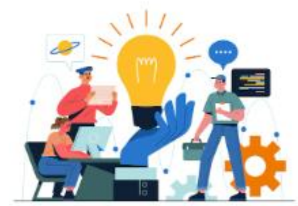
การพัฒนานวัตกรรมอื่นที่เป็นประโยชน์ทางธุรกิจ