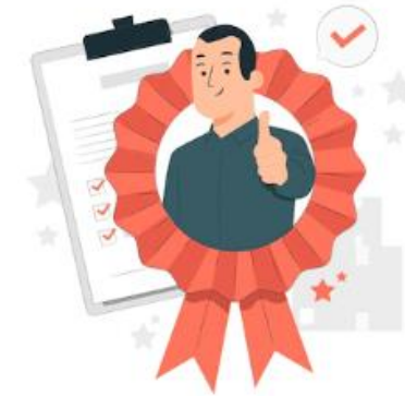
การพัฒนาคุณภาพและมาตรฐานสินค้าและบริการ