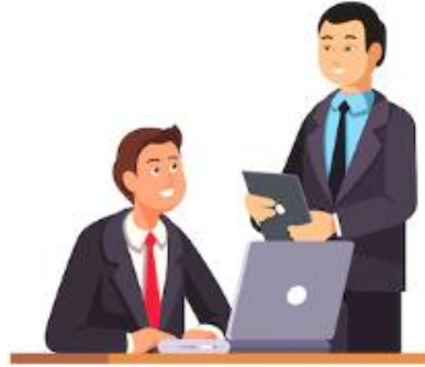
การพัฒนาและบริหารธุรกิจ