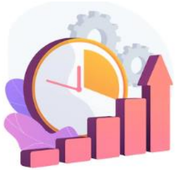
การเพิ่มผลิตภาพและประสิทธิภาพธุรกิจ