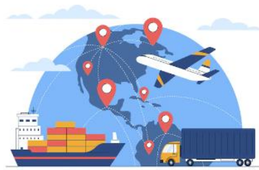
การพัฒนาตลาดต่างประเทศ